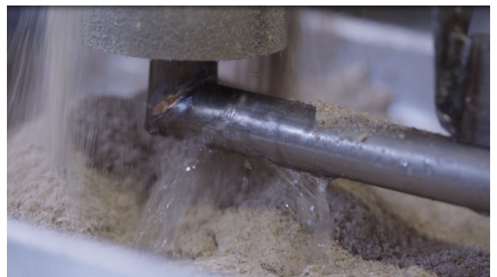
Wasser und Futter wird erst im Trog gemischt